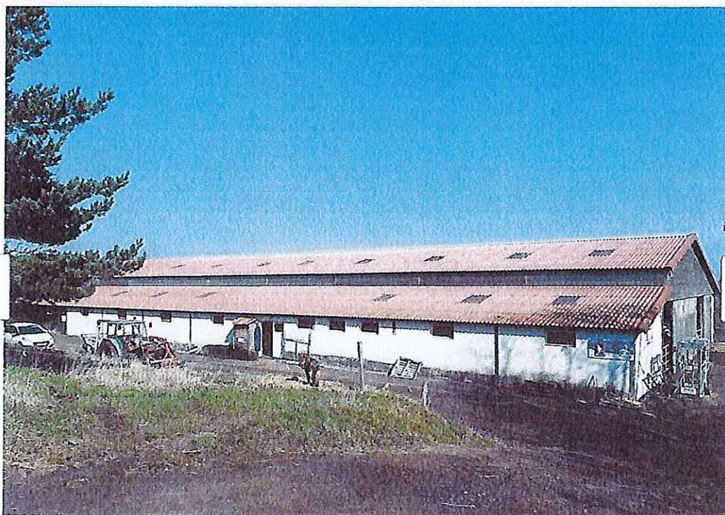
GAEC en production bovin lait à reprendre